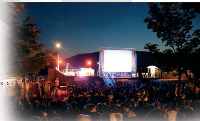
CELA FAIT DÉJÀ 4 ANS QUE CINÉFIL FAIT ÉTAPE À VALENCE.

A Valence, c'est le groupe grenoblois Imaz'elia dont les sonorités tziganes, arabes et andalouses, ont envouté les spectateurs. La projection de courts-métrages qui a suivi a quant à elle été largement raccourcie en raison de la dégradation des conditions climatiques : les aléas du plein air ! On attend avec impatience l'édition 2011 de Cinéfil, en espérant que le vent et la pluie ne s'inviteront pas à la fête !